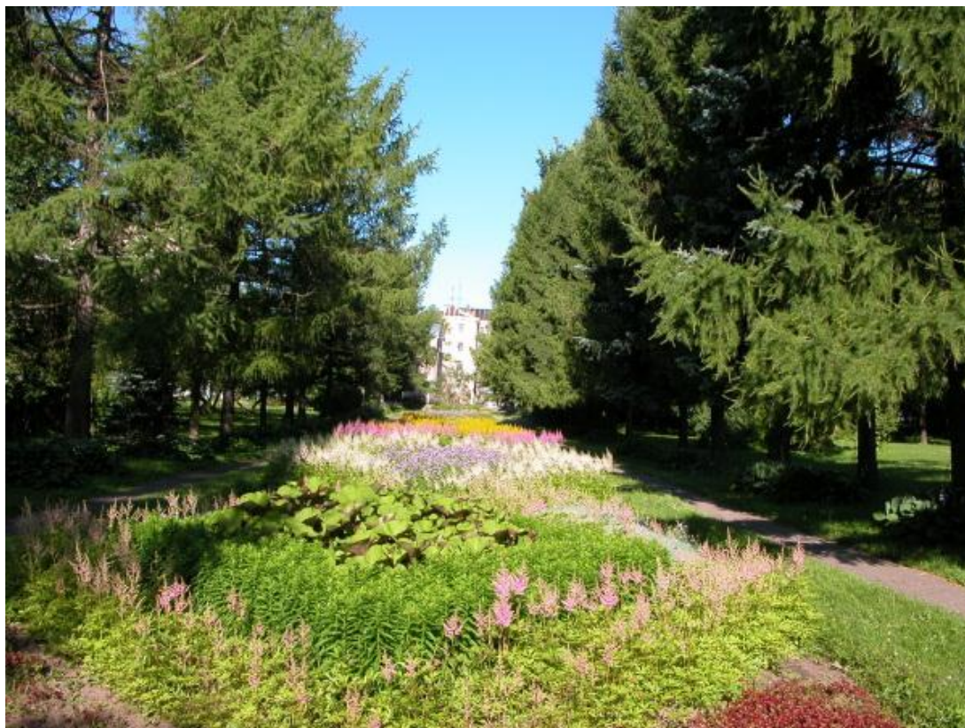
Рисунок – Ботанический сад

фотосессий — яркость и красота растений в период цветения, осенний парк с листопадом и зимний сад, окутанный снегом, влекут сюда ценителей прекрасного.