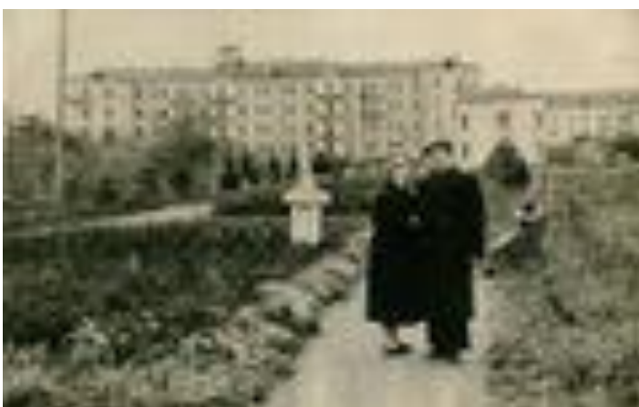
Ботанический сад. Коммунистическая улица. Перестроенная Успенская единоверческая церковь. Конец 1950-х