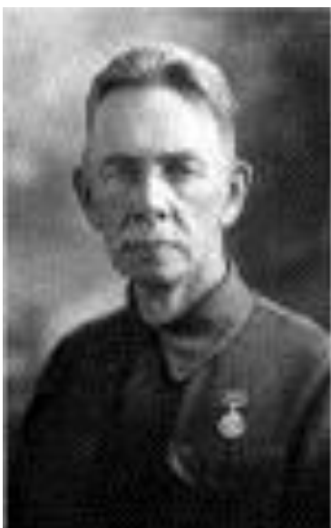
Никольский, Леонид Дмитриевич(1876 – 1953)