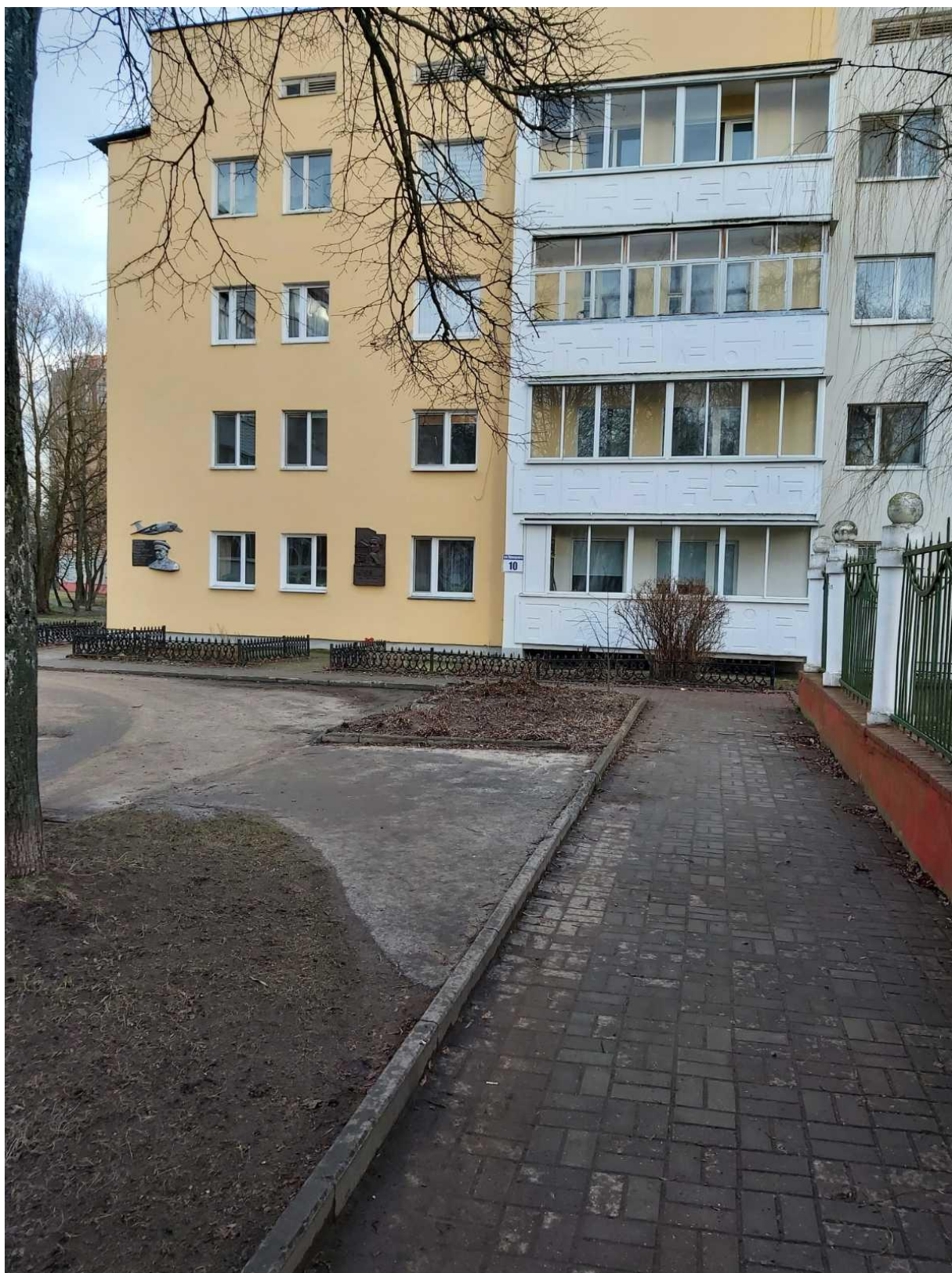
Рисунок – улица Садовая