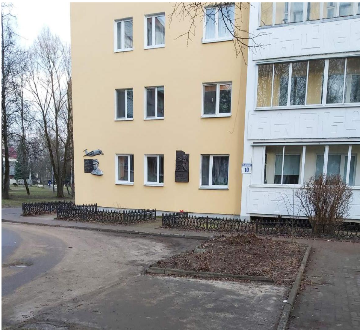
Рисунок – дом по улице Садовой