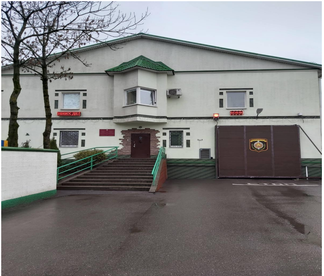
Современный вид СИЗО № 2 со стороны улицы Гагарина